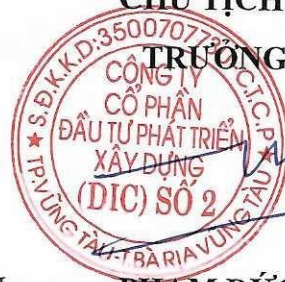
PHẠM ĐỨC DŨNG